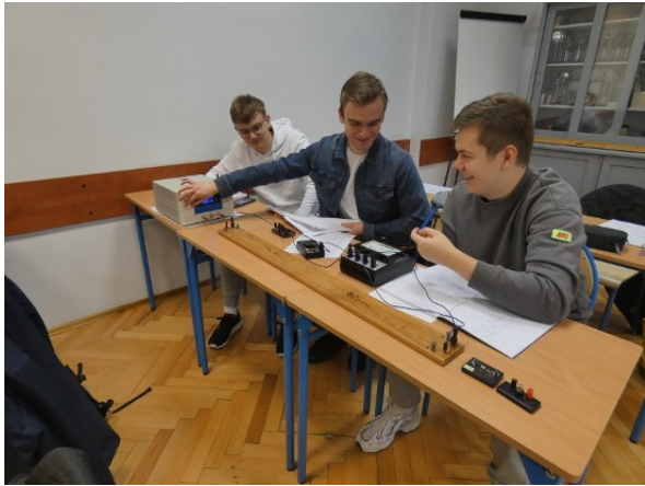
Grupa 3de – pomiary elektryczne