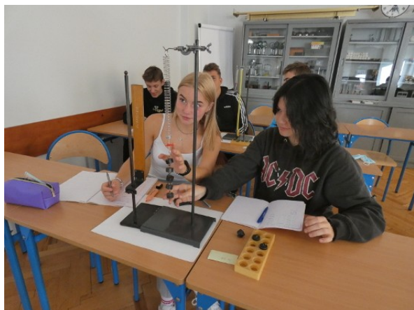
Grupa 3bde – badanie wydłużenia sprężyny

Zakończył się kolejny rok szkolny. Jaki był? Po nauczaniu zdalnym wróciliśmy do szkoły. Początkowo zajęcia odbywały się w różnych salach, ale po miesiącu lekcje fizyki wreszcie zaczęły się odbywać w pracowni fizycznej. To umożliwiło nam szerzej wykorzystać eksperyment fizyczny. Poza obserwacją zjawisk fizycznych wszyscy uczniowie mieli okazję wykonywać pomiary.