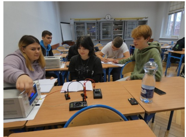
Grupa 3bde – pomiary elektryczne