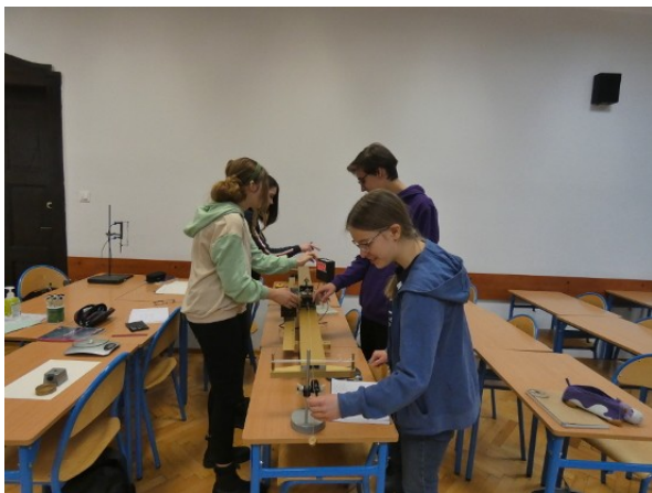
Klasa 1d – sprawdzanie drugiej zasady dynamiki