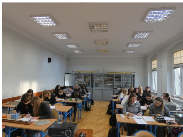
Klasy 3 wykonywały pomiary elektryczne. Na zdjęciach kl. 3b1 i kl. 3c1.