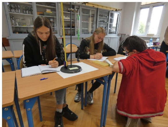
Klasa 3c – badanie wydłużenia sprężyny