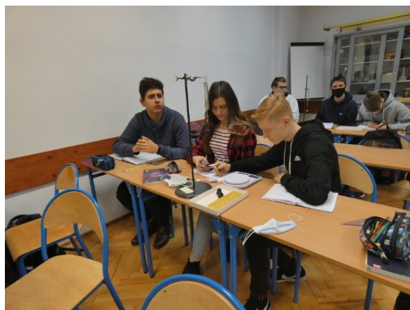
Klasa 2d – badanie drgań ciężarka na sprężynie