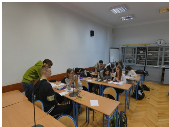
Klasa 2d – badanie wydłużenia sprężyny